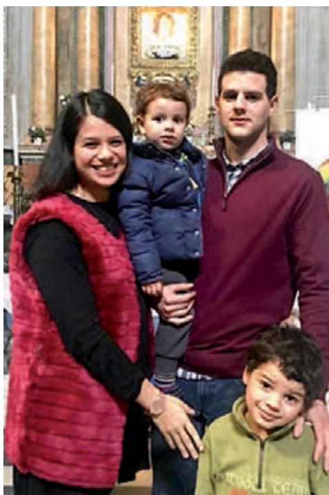
GEMELLAGGI MONDIALI DI VITA

Mi ero adattata, falsificata ed integrata per paura di restare sola. Stavo male senza sapere perché. Grazie a Dio e al Suo amore per me, una mia professoressa del liceo, coinvolta con "Mondo Solidale - Italia Solidale", iniziò a testimoniarmi dei contenuti che non capivo, ma che mi sembravano qualcosa di nuovo. Inoltre una mia cara amica che aveva molte difficoltà, la vidi cambiare moltissimo grazie all'esperienza con questo movimento. Mi avvicinai molto a lei perché mi passava qualcosa di grande. Avevo 20 anni quando conobbi Padre Angelo e la realtà del "Mondo Solidale". Anche se non capivo, sentivo che queste nuove relazioni mi facevano bene, mi facevano toccare la parte più vera di me. Risentivo relazione vera con me stessa e con Dio. Dopo pochi mesi, Padre Angelo ebbe subito fiducia in me e mi affidò una missione in Brasile. Questo significava entrare in relazione e sostenere 200 famiglie povere che facevano questo cammino con i libri, i "giardini" e la mis-